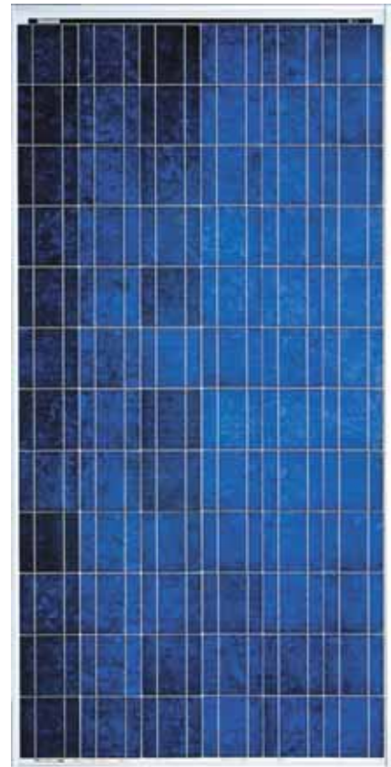
BP 3175 Maßstab 1:14

Gerahmte Module sind von "Underwriters Laboratories" für elektrische Sicherheit und Brandschutz Klasse C zugelassen.