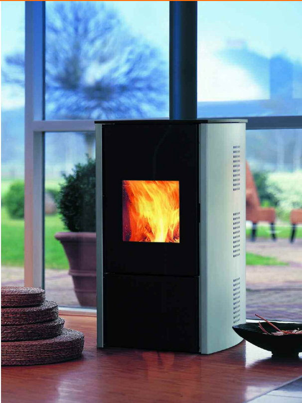
LENIUS AP oder LENIUS CP - Sehr ansprechend im Wohnzimmer

Der LENIUS CP ist für seine guten Emissionswerte und seine sehr gute Energieeffizienz mit dem Blauen Engel ausgezeichnet