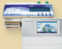
Meteococontrol WEB'log und Meteococontrol WEB'log Comfort Datenlogger