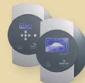
Solar-Log 500/1000™ Datenlogger