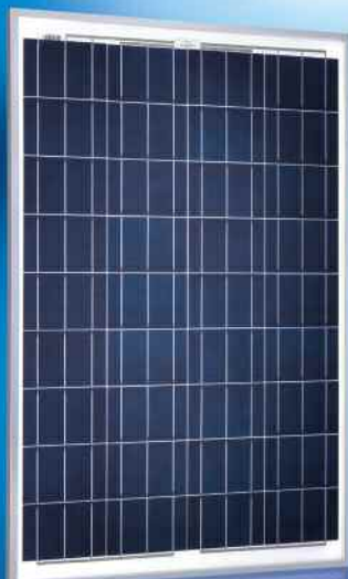
Sunmodule® SW 80 poly/RIA