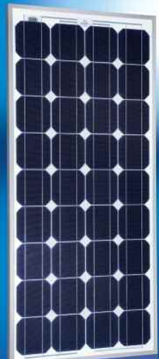
Sunmodule® SW 80 mono/R5A