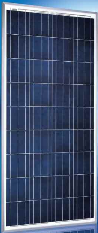
Sunmodule® SW 120 poly/R6A