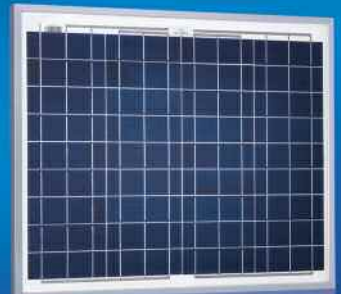
Sunmodule® SW 40 poly/R5A