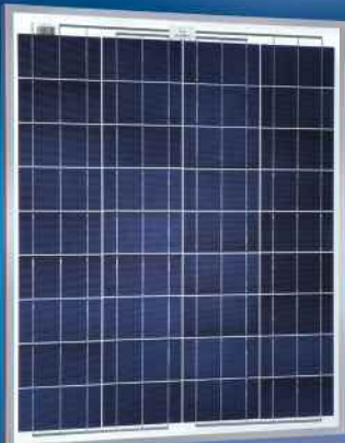
Sunmodule® SW 60 poly/RHA