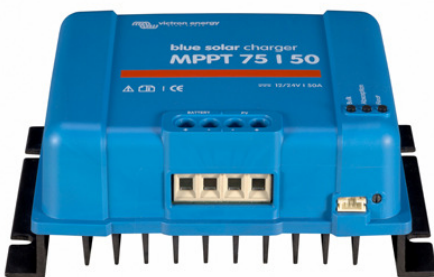
Solar-Lade-Regler MPPT 75/50