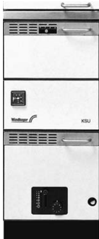
Heizen und Kochen