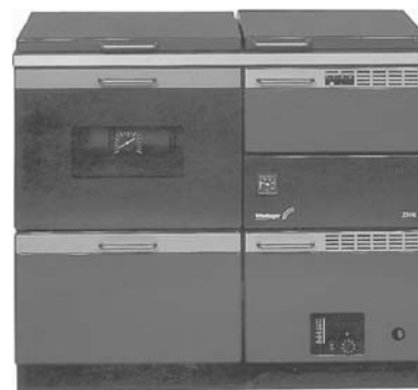
Heizen und Kochen und Backen